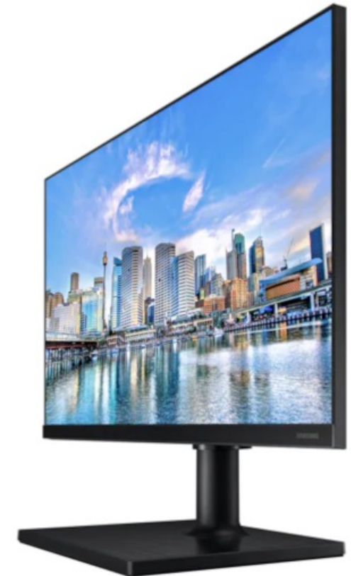
Samsung F24T450FQR Office Monitor