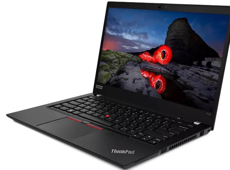
Lenovo Thinkpad T-Series Notebook