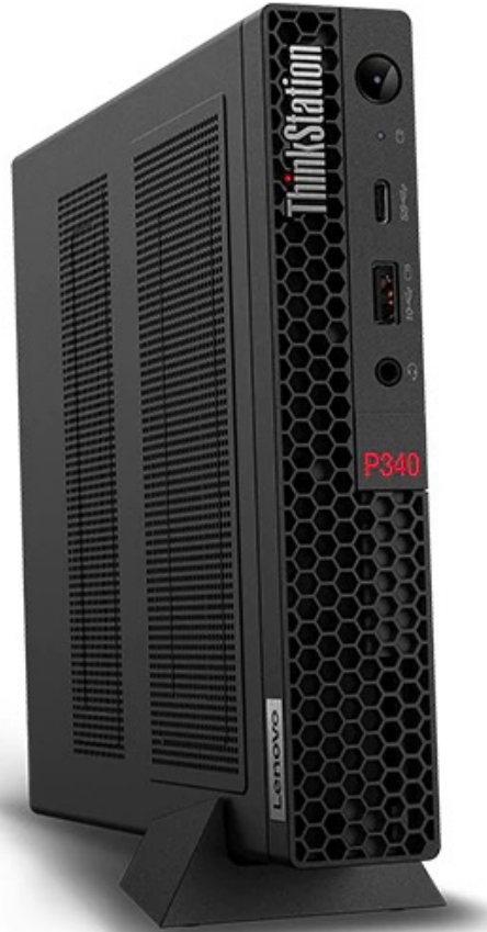
Lenovo ThinkCentre P340 Desktop PC