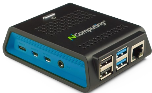
NComputing RX420 ThinClient