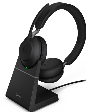
Jabra Evolve 65 2